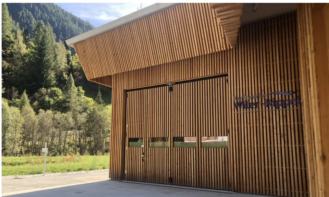
Falttor mit bauseitiger Holzbeplankung