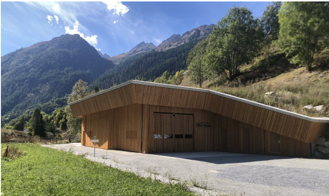
Falttor mit bauseitiger Holzbeplankung