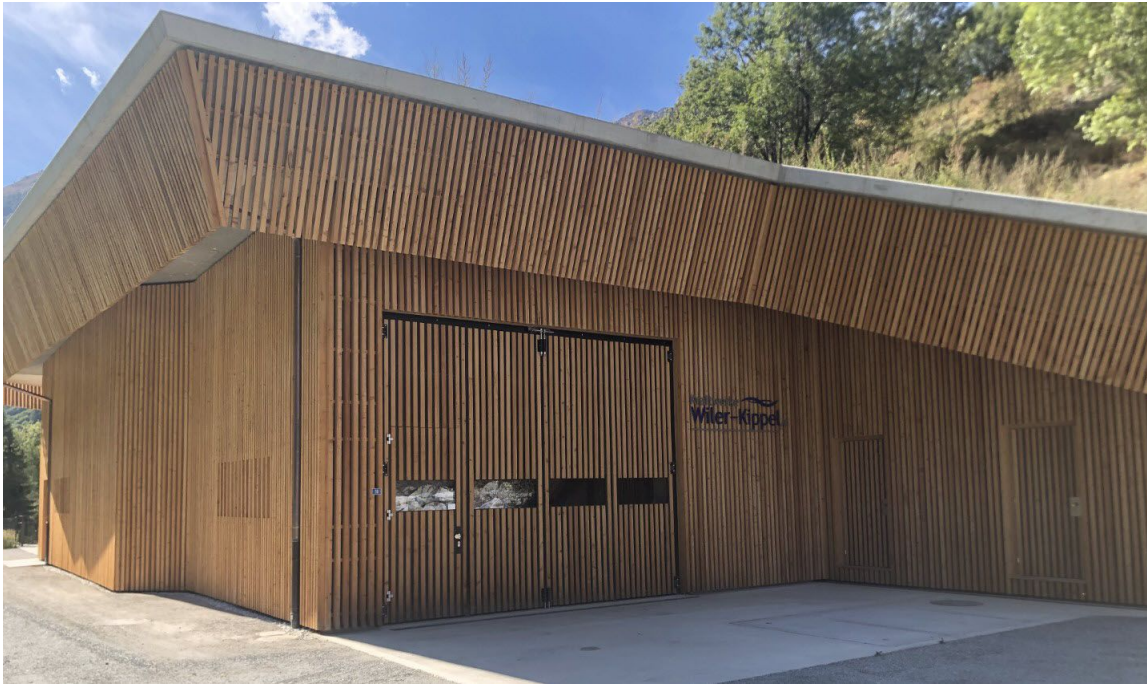
Falttor mit bauseitiger Holzbeplankung